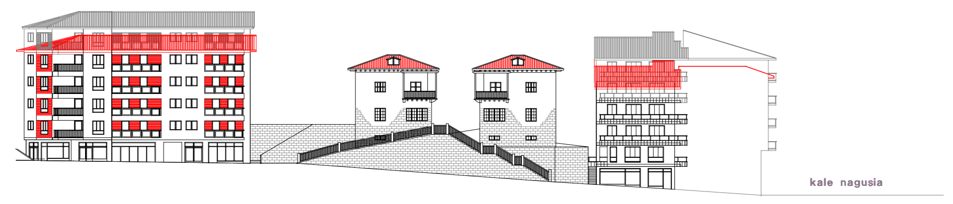
cota 100 alzado rio kale nagusia pares cota 100 alzado posterior san martin kalea

2 4 6 8 10 14 16,18,20y22 24 1 2 3 3bis 4 5