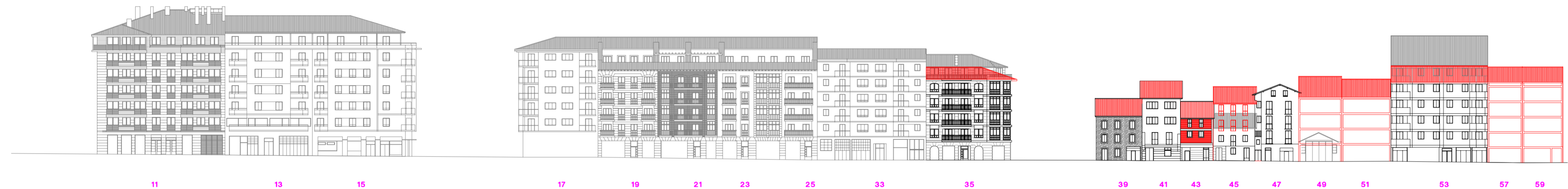
cota 100 alzado santa clara katea impares