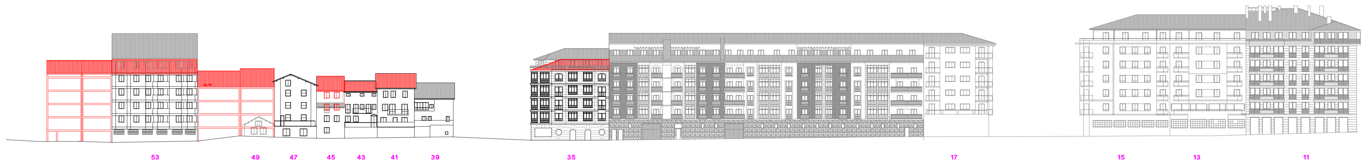
cota 100 alzado trasero impares